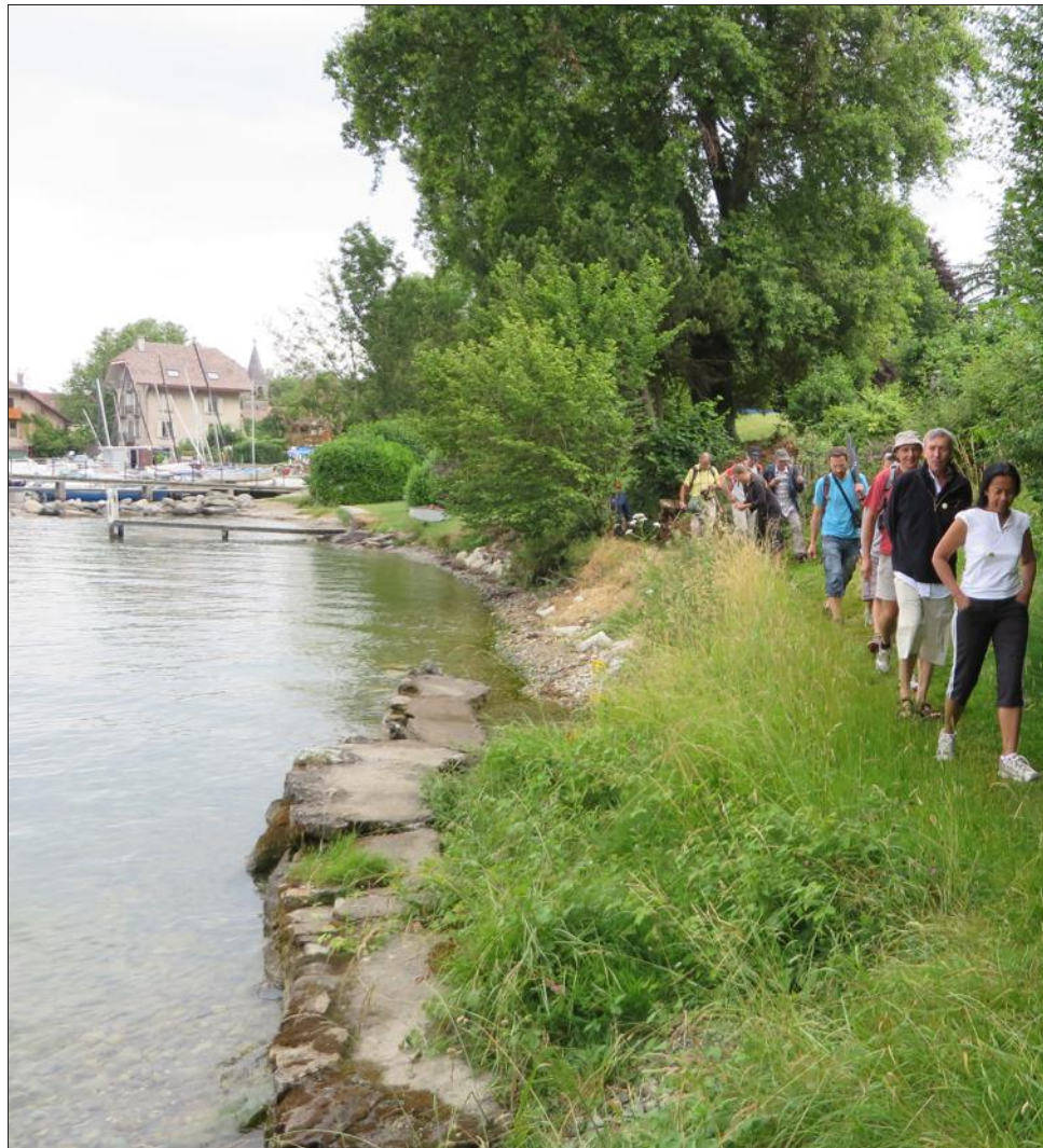
Les membres de l'association dressent des états des lieux réguliers de façon très empirique.