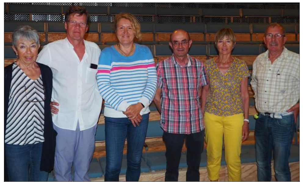
Les membres du conseil d'administration de l'association.